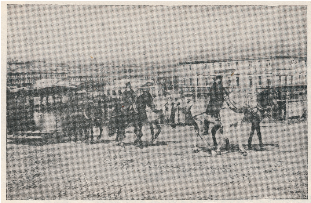
Подъём конки в гору в дореволюционной Москве

Форейтор – наездник на передней лошади в случаях, когда в повозку было запряжено две пары лошадей. Форейтор помогал управлять повозкой.